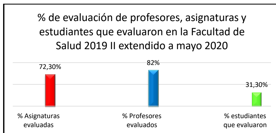
Grafica 2. % de evaluación de profesores, asignaturas y estudiantes que evaluaron en la Facultad de Salud en el periodo 2019 II extendido mayo 2020.

Los indicadores registrados en el sistema, arrojan la siguiente información: El 31.3% (15.269) de los estudiantes realizaron evaluación en las diferentes asignaturas de las Unidades Académicas. Con relación al número de docentes y cursos evaluados se logró un total de evaluaciones 1.396(82%) de docentes, teniendo en cuenta que un docente puede estar evaluado varias veces según el número de asignaturas que tenga a su cargo. El total de asignaturas evaluadas fue de 1.014 (72.3%). (Ver grafica 2)